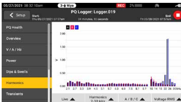
Ett fullständigt övertonsintervall finns tillgängligt från de första övertonerna på 50 heltal och från 2 kHz till 30 kHz

Fluke 1770-serien är utformad för att vara säker och enkel att använda i alla mätmiljöer. Med 1770-serien kan du registrera ett komplett utbud av elkvalitetsvariabler samt höghastighetsvågformer, höghastighetstransienter och övertoner med högre frekvens, som alla kan ses direkt på den stora skärmen med hög upplösning. Med en förstklassig överspänningsklassning på CAT IV 600 V/CAT III 1000 V kan analysatorerna användas vid serviceingången eller nedströms och mäta AC- och DC-ingångar och övertoner upp till 30 kHz. Tack vare 1770-serien kan du vara säker på att du kan registrera de data du behöver för att fatta bättre underhållsbeslut oavsett uppgift.