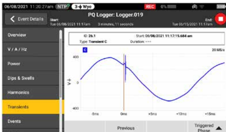
Se spänningstransienter i realtid samtidigt som du loggar för snabbare felsökning

Varje dag har transienter en negativ inverkan på system som annars skulle varit i gott skick, och risken för skador på utrustningen kan inte underskattas. Oavsett om ditt system har impulsiva eller oscillerande transienter kan resultaten vara förödande och orsaka problem, från isoleringsfel till totala utrustningshaverier. Fluke 1775 och Fluke 1777 har avancerad teknik för transientregistrering som hjälper dig att tydligt identifiera transienter vid höghastighetsspänning, så att du har de data du behöver för att stoppa dem på en gång. Elkvalitetsanalysatorn Fluke 1775 har 1 MHz samplingskapacitet för att registrera snabba transienter, medan elkvalitetsanalysatorn Fluke 1777 har 20 MHz samplingskapacitet för att registrera de snabbaste transienterna med hög detaljrikedom.