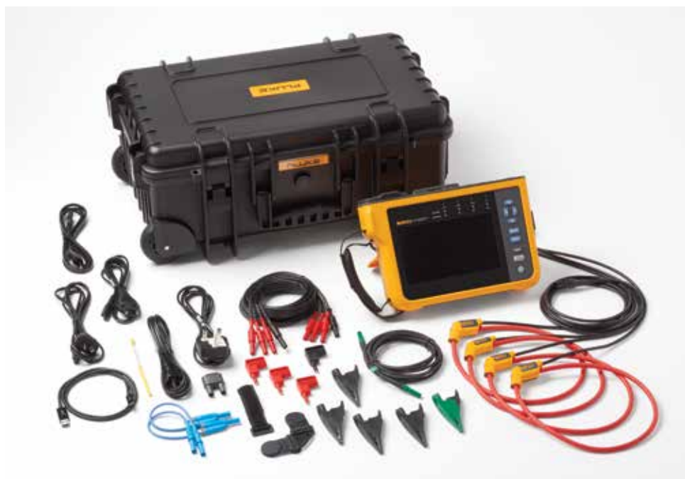
Fluke 1777 elkvalitetsanalysator. Obs! De artiklar som ingår varierar beroende på modell och visas i tabellen "Beställningsinformation".