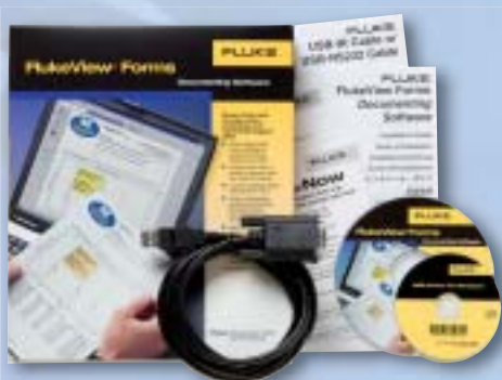
FlukeView® Forms programvara och kabel