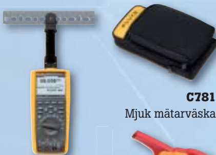
C781 Mjuk mätarväska