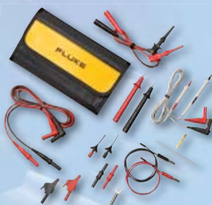
TLK287 Elektronisk testkabelsats