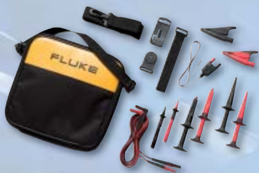
TLK289 Industriel testkabel kit

Det finns ett brett utbud av tillbehör som maximerar produktiviteten hos Fluke 289 och Fluke 287 men följande tillbehör är viktiga för de flesta användare.